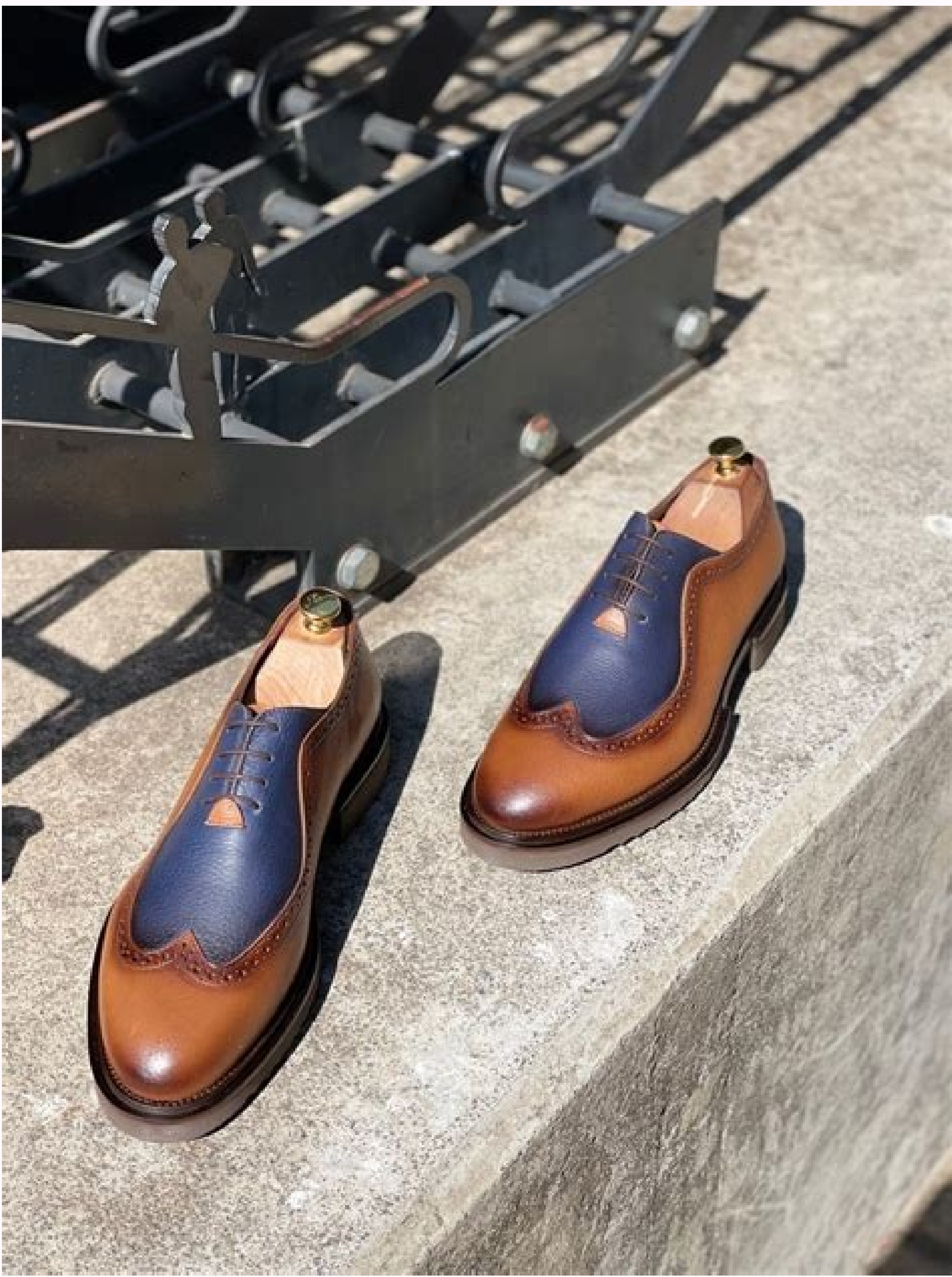
Baby formal leather shoe